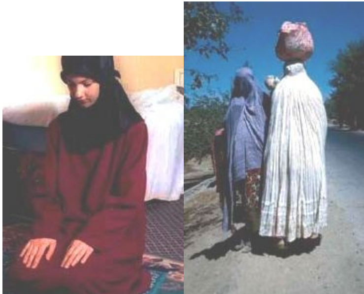
Tenue de la femme musulmane : selon la tendance libérale (à gauche), et selon la tendance non libérale (à droite).

Pour être complet sur la notion de « parties intimes » des femmes musulmanes, il faut mentionner l'existence d'une controverse d'interprétation entre les différents docteurs de la foi musulmane, sur l'étendue de ces parties : selon certains en effet, elles comprennent, comme nous l'avons dit, tout le corps à l'exception du visage et des mains : c'est la tendance libérale. Mais certains Imams donnent une extension différente à ces « parties intimes » ; pour eux elles comprennent tout le corps y compris le visage et les mains . Cette tendance moins libérale est celle admise, par exemple, en Afghanistan, où l'adoption traditionnelle de cette interprétation (bien avant l'arrivée au pouvoir des Talibans) contraint les femmes à porter un voile équipé d'une grille métallique, pour cacher leur visage.