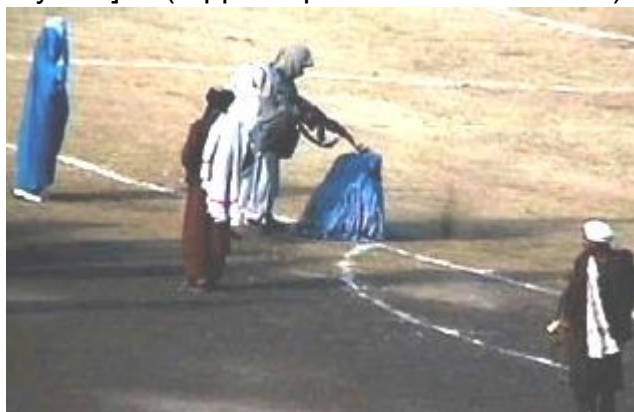
Exécution d'une femme adultère en Afghanistan.

« Il n'est pas licite de répandre le sang d'un musulman, sauf dans l'un de ces trois cas : une personne mariée qui commet l'adultère, une vie humaine pour une vie humaine, et celui qui abandonne sa religion en se séparant de la Oumma [Communauté des croyants] ». (rapporté par Bukhari et Muslim).