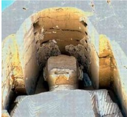
Bouddha géant d'Afghanistan, mutilé par les talibans