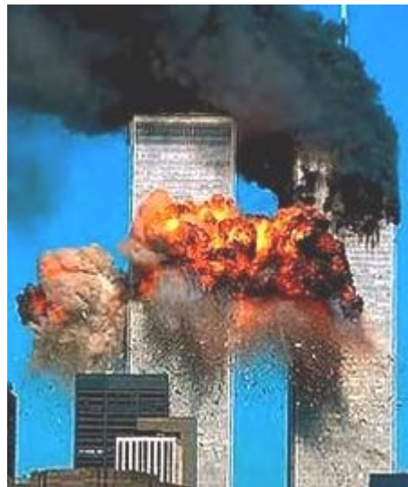
Les attentats du 11 septembre 2001

Il n'est qu'à voir également, passées ces premières réactions spontanées, l'absence de condamnation formelle de ces attentats meurtriers par la majorité des musulmans, et même les tentatives d'excuses et de justification de ces actes barbares au nom d'une prétendue culpabilité des Etats-Unis, voire de l'Occident tout entier.