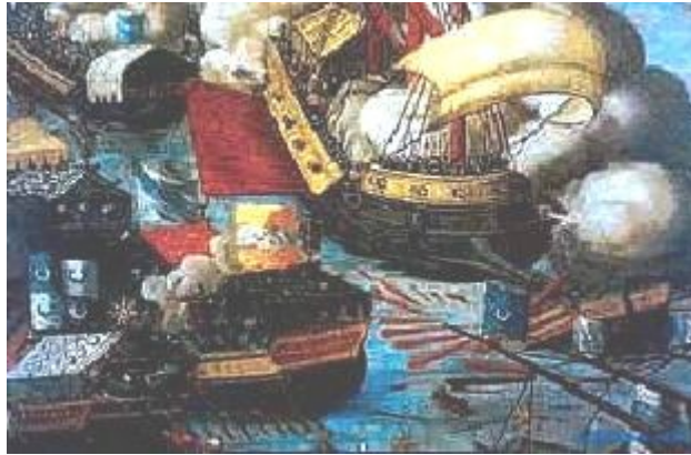
La bataille de Lépante, en 1571

La grande victoire chrétienne de Lépante a totalement défait cette flotte turque, qui ne s'est jamais totalement reconstituée, mettant ainsi fin (ou du moins en ralentissant la fréquence et l'ampleur) à ces pillages et enlèvements, sécurisant davantage la Méditerranée, mais surtout, bien sur, sauvant Rome et la Chrétienté d'Occident de subir le même sort que Constantinople et la Chrétienté d'Orient.