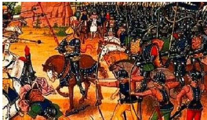
La bataille de Poitiers