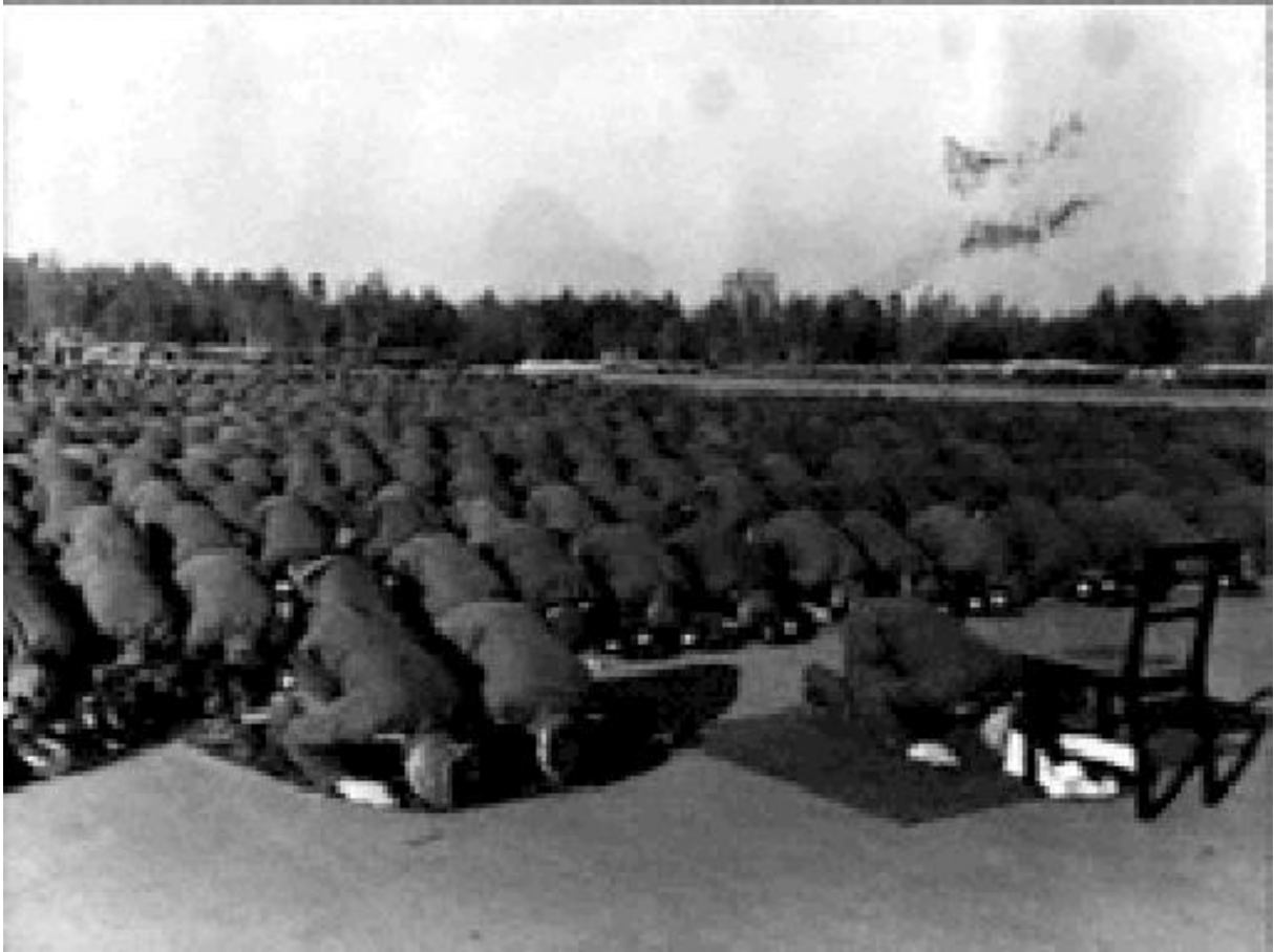
Prière musulmane par les Waffen SS musulmans