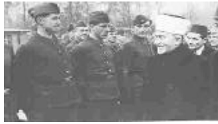
Revue de troupe des Waffen SS musulmans par le Mufti, à Berlin...