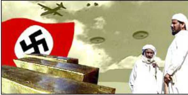
Affiche de propagande arabe mettant en scène canons, avions et drapeaux nazis

Le parti du "Hisb-el-qaumi-el-suri" (PPS) ou Parti National Socialiste en Syrie en est un exemple. Son leader, Anton Saada a copié son style sur le Führer de la nation syrienne, et Hitler devint connu dans ce pays sous le nom de "Abu Ali" (En Egypte son nom était "Muhammed Haidar"). La bannière du PPS portait la svastika sur un fond noir et blanc. Plus tard, une branche libanaise du PPS, qui recevait encore ses ordres de Damas, fut impliquée dans l'assassinat du président libanais Pierre Gemayel.