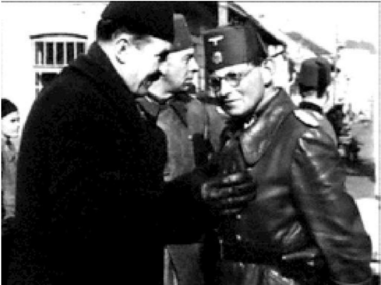
Un dirigeant des Waffen SS musulmans. On notera l'insigne nazi du fez