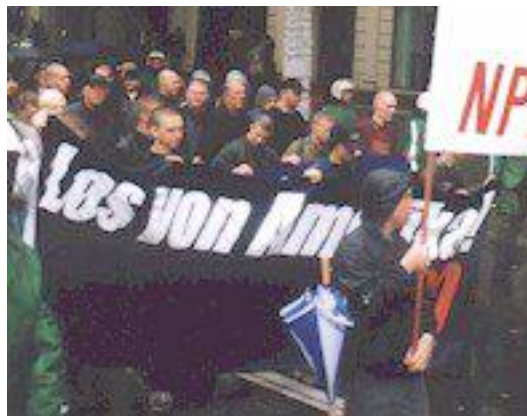
Manifestations nazies du 3 Octobre en Allemagne « A mort les Américains »

Les manifestations néo-nazies du 3 octobre en Allemagne associaient ouvertement la haine du Juif à la haine de l'Amérique et appelaient à attaquer les Juifs et les Américains « Avec Odin et Allah » (« Mit Odin und Allah »), prenant ouvertement fait et cause pour les Islamistes.