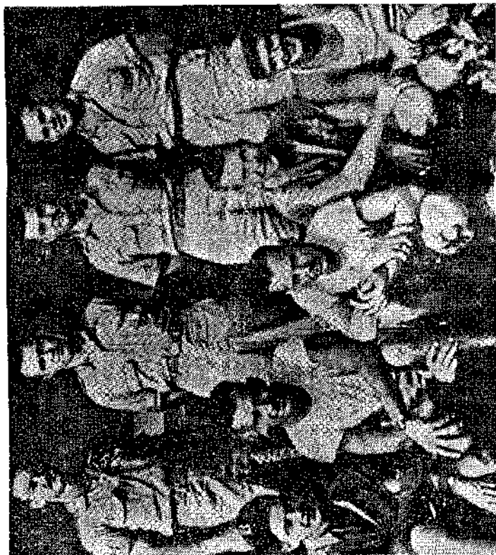
Die Essenz des Hiroshima den Tod bringenden amerikanischen Bombenflugzeuges einige Tage nach der Rückkehr vom Massenmord. Die Schwermerebrücker strahlen, wissen sie doch, daß sie zu dem Siegern gehören und darum köhnterl Strijberföigung oder gar Sühne zu erwarten haben.

tober 1939 erschien beim Prä- Vereinigten Staaten von Nord- nikht: D. Roosevelt der Bankier abwies Alexander Sachs. Um