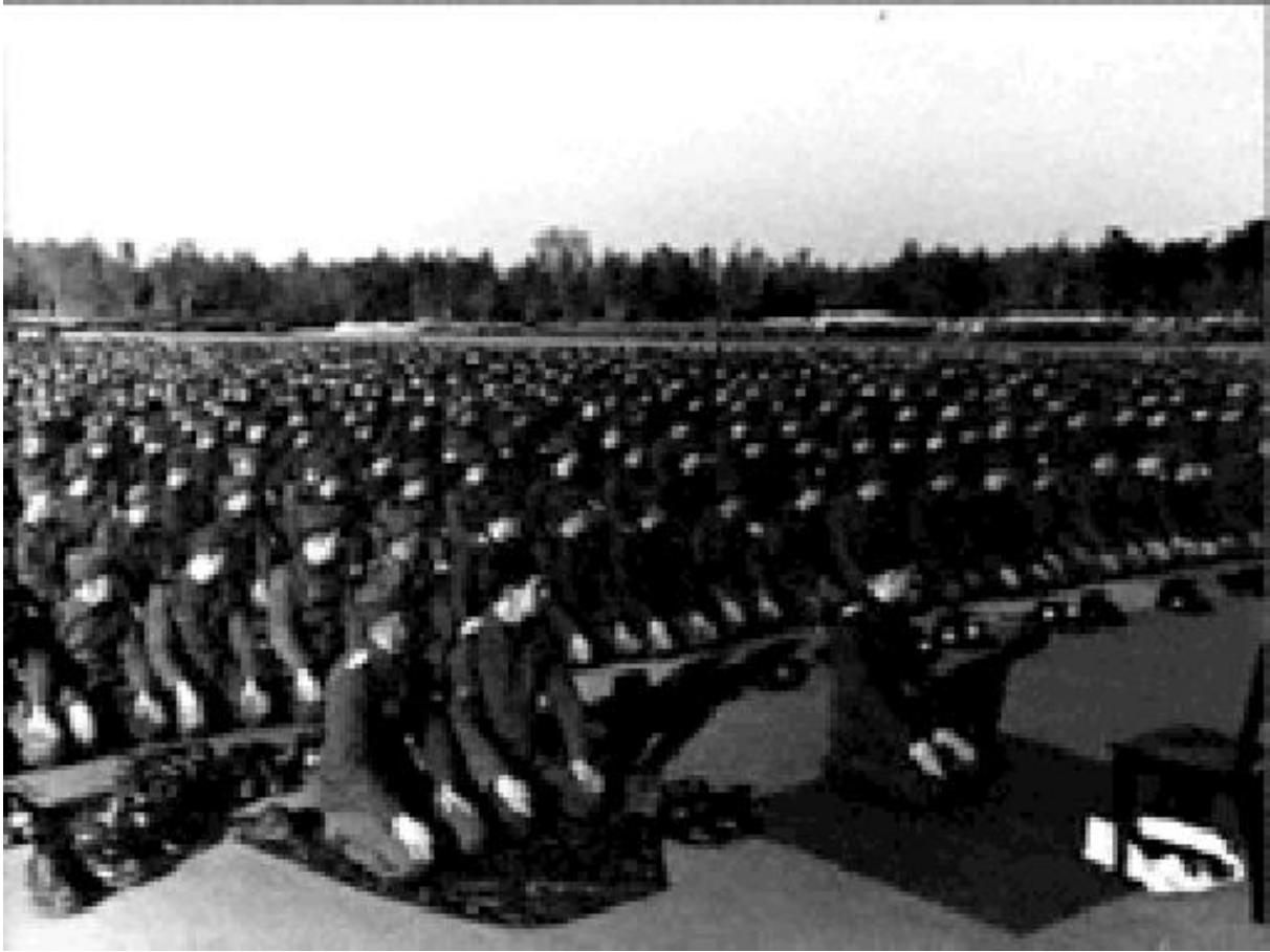
Prière musulmane par les Waffen SS musulmans